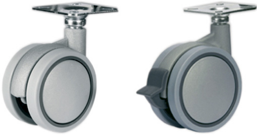
Колёса из полиамида 6 серого цвета