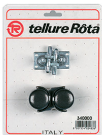
Колёса из полиамида 6 чёрного цвета В упаковку входят 2 шт. 4 соединения