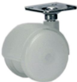
Колёса из прозрачного полипропилена