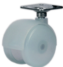
Колёса из полипропилена с голубым оттенком