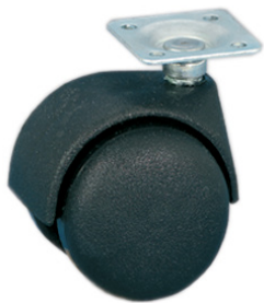
Колёса из полиамида 6 чёрного цвета