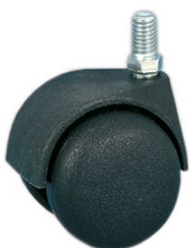
Колёса из полиамида 6 чёрного цвета