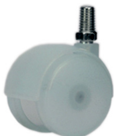
Колёса из полипропилена с голубым оттенком