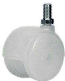
Колёса из прозрачного полипропилена