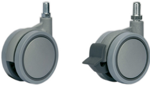
Колёса из полиамида 6 серого цвета